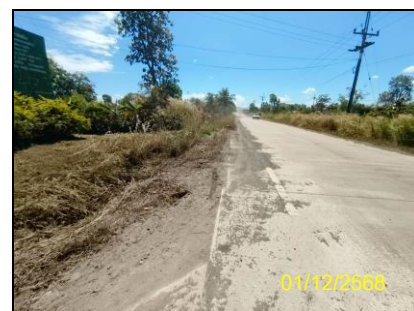
รูปที่ 1-2 เส้นทางคมนาคมเข้าสู่พื้นที่โครงการ